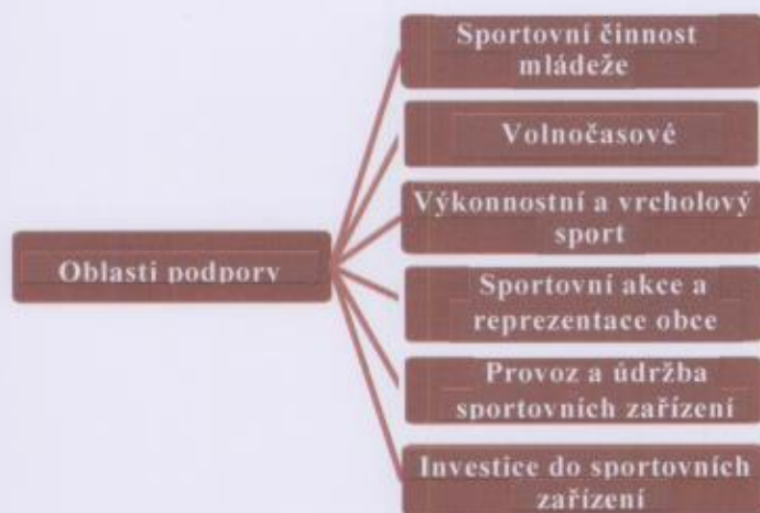
Obrázek 1: Oblasti podpory sportu